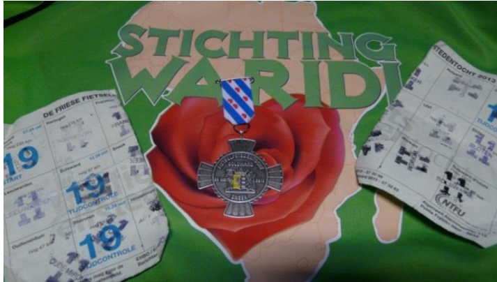
Mijn Elfstedenmedaille en doormidden gescheurde stempelkaart

Stichting Waridi ondersteunt sinds 2010 een Afrikaanse zorgboerderij met kippen in Oeganda. Meisjes vanaf 12 jaar die uit de prostitutie komen worden via het project Destiny Women opgevangen en krijgen (arbeids) therapie en vakscholing. Een stal voor de kippen is klaar en de eerste inkomsten uit eieren zijn een feit.