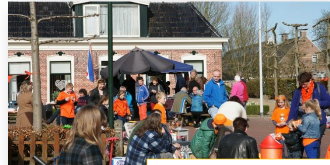
Een gezellige drukte met een heerlijk zonnetje